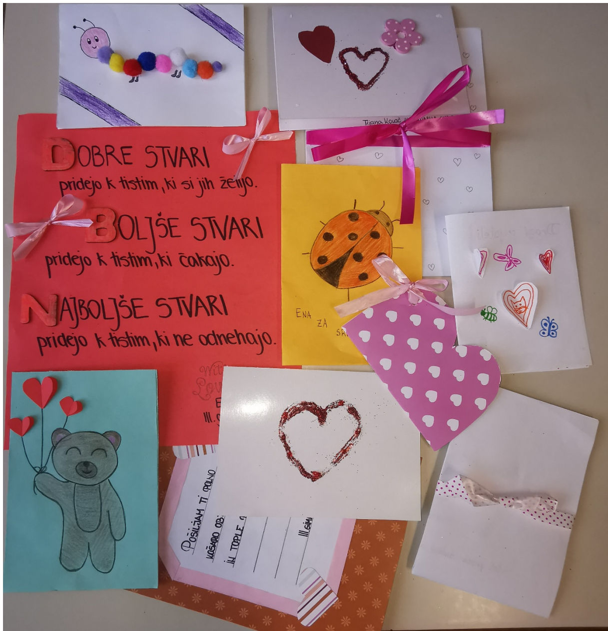
Mentorica: Janja Divjak